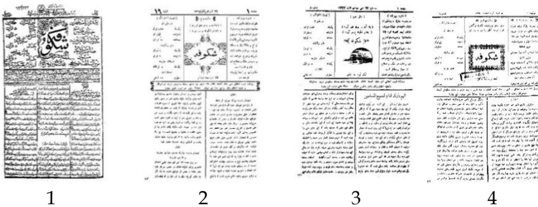
Abbildung 2: Die Titelseiten von Šokūfe in jedem Jahr

Šokūfe bestand aus vier Seiten und erschien in Duodezformat. Im ersten Erscheinungsjahr war die Druckform Lithografie und die Schriftart Naschī. Ab der dritten Nummer wurde die Schriftart Nasta‘īq und ab dem zweiten Jahr wurde es mit beweglichen Lettern gedruckt. Im ersten Jahr wurde der Inhalt in vier senkrechten Spalten und ab dem zweiten Jahr in zwei senkrechten Spalten gedruckt. Die Anzeigen wurden von dem Inhalt durch Rahmen getrennt. Obwohl durch Anwendung der beweglichen Lettern die Schönheit des Layouts beeinträchtigt wurde, machten jedoch die zwei Spalten sowie Ordnungen des Inhalts und der Abstand zwischen den Linien das Lesen leichter.