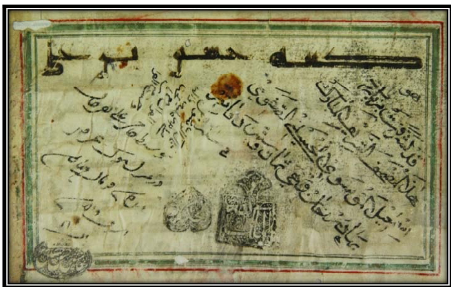
Bild Nr. 1 : Koran mit der Nummer 3382 der Astan Quds Razavi mit der zugeordneten Signatur von Imām Ḥussains (Friede sei auf ihn).

Unter allen Beispielen ist dieses Manuskript das Einzige, worin das arabische Satzglied in dritter Person Singular (er/sie/es) ist und nicht wie in den anderen Manuskripten in erster Person Singular (ich legte Audienz ab) zu finden ist.