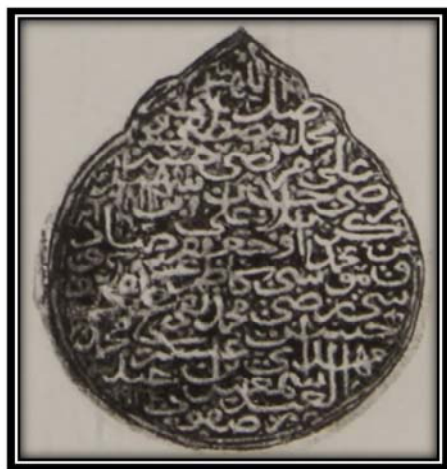
Bild Nummer 11 : Der Siegel, welches Šāh Ismā'īl zugeschrieben wird.

Manuskriptes und deren Signatur. Interessant ist zu beobachten, dass sich diese Fälschung vor allem in den weiteren Seiten dieses Manuskriptes Minutoli 296 aus der Staatsbibliothek zu Berlin ereignete. Der Fälscher fügte nach der Stellungaufwertung an jedem Seitenende anhand der Nachahmung der Audienz „Sulaimān al-Abdāl“ die Visitation Šāh Ismā'īls hinzu. Außerdem stellt man fest, dass er sich sehr gut mit einigen kufischen Koranexemplaren (die den Imamen zugeschrieben wurden) und den Stiftungsurkunden der nächsten safawidische Monarchie Šāh 'Abbās und Šāh Tahmāsb aus Mašhad und Ardebīl auskannte. Mit diesem Hintergrundwissen versuchte er somit Šāh Ismā'īl als einzigen Visitor dieser Manuskripte darzustellen, ohne ihn dabei als Stifter dieser Koranmanuskripte zu machen.