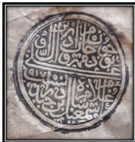
Bild Nummer 12 : Der Siegel, welches Šāh Ismā'īl zugeschrieben wird.