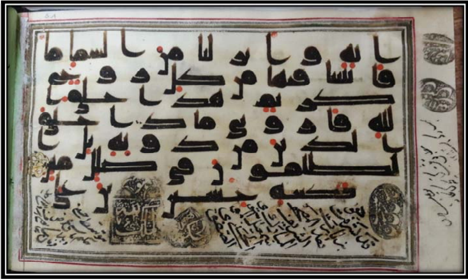
Bild Nr. 2: Koran mit der Nummer 1046 der Bibliothek des Golestan-Palastes mit der zugeordneten Signatur von Imām Ḥussains (Friede sei auf ihn).