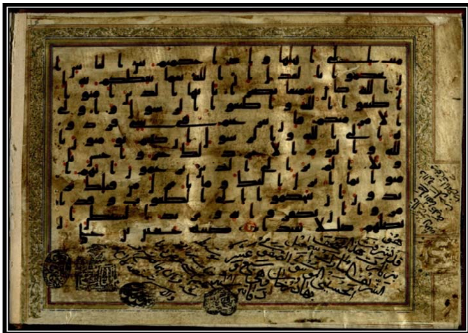
Bild Nr. 5: Koran mit der Nummer 1041 aus der Bibliothek des Golestan-Palastes mit der zugeschriebenen Signatur Imām Ḥussains (Friede sei auf ihn).