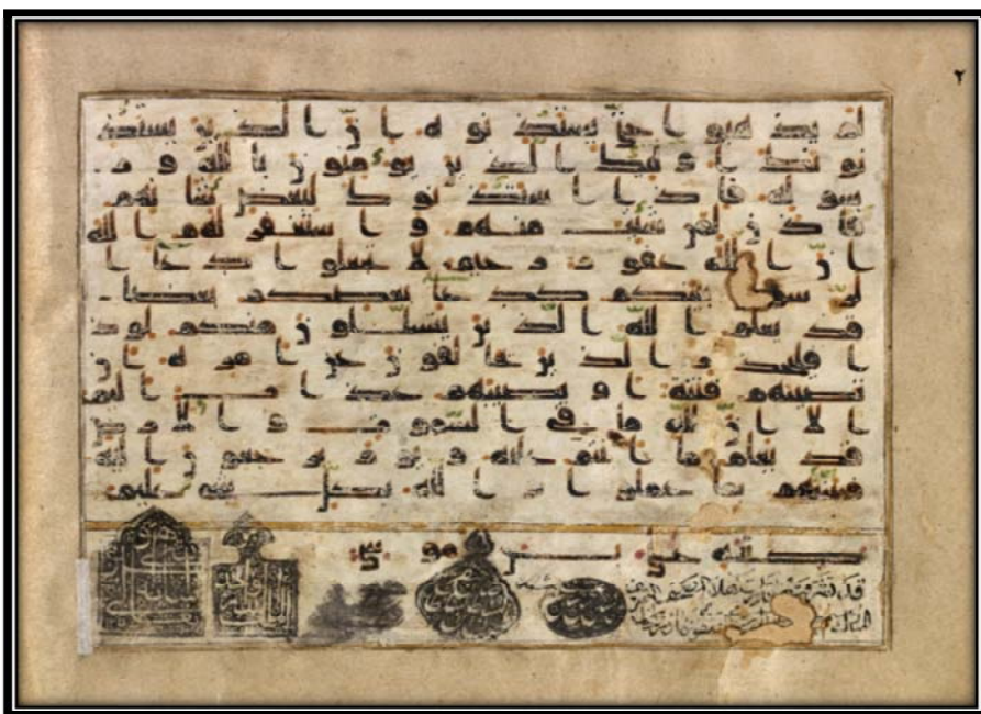
Bild Nr. 9 : Koran mit der Nummer 1586 aus der Astan Quds Razavi mit der zugeschriebenen Signatur Imām Riḍas (Friede sei auf ihn).