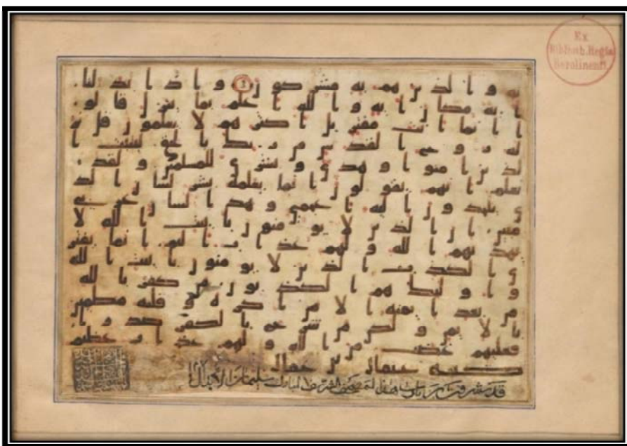
Bild Nr. 8 : Koranische Manuskripte mit der Nummer 296 MS. Or. Minutoli aus der Staatsbibliothek zu Berlin mit der zugeschriebenen Signatur 'Utmān ibn 'Affān