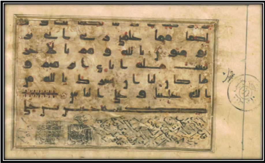
Bild Nr. 10 : Koran mit der Nummer 10 aus der Malek- Bibliothek mit der zugeschriebenen Signatur Imām Ḥassans (Friede sei auf ihn).