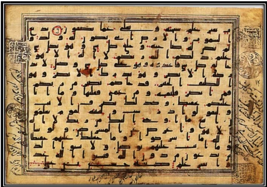
Bild Nr. 7: Verkauftes Manuskripte aus der Christie's Versteigerung, London, 13. Oktober 1998, Artikelnummer 11, mit der zugeschriebenen Signatur Imām Ḥussains (Friede sei auf ihn).