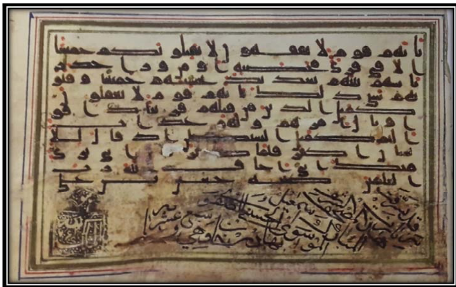
Bild Nr. 4: Verkaufte Manuskripte der Christie's Versteigerung, London, 12. Oktober 1999, Artikelnummer 6, mit der zugeordneten Signatur Imām Ḥussains (Friede sei auf ihn).