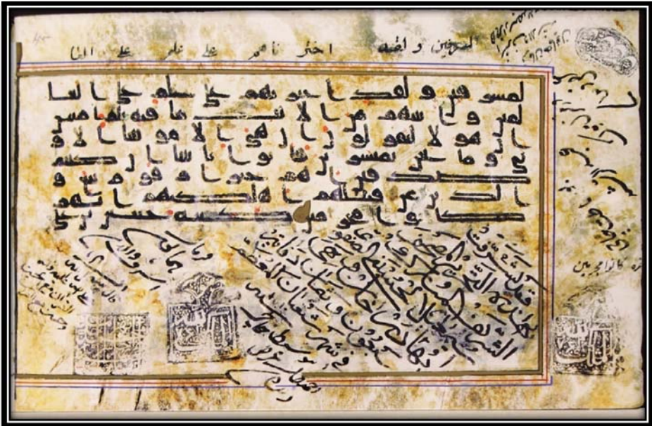
Bild Nr. 3: Koran mit der Nummer 1037 aus der Bibliothek des Golestan-Palastes ist mit der zugeordneten Signatur Imām Ḥussains (Friede sei auf ihn).